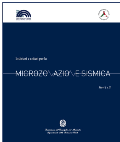
Figura 1: Copertina del volume “Indirizzi e criteri per la Microzonazione sismica” ( www.protezionecivile.it )

Gli standard in questione sono resi disponibili dalla Commissione Tecnica Nazionale nel sito del Dipartimento della Protezione Civile della Presidenza del Consiglio dei Ministri ( www.protezionecivile.it ).