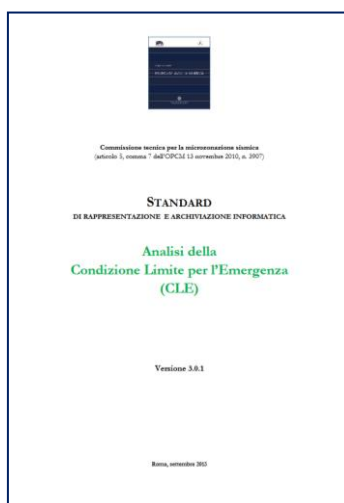
Figura 2: Standard di rappresentazione e archiviazione informatica per l’Analisi della CLE ( www.protezionecivile.it )

Il documento sugli standard (Figura 2) è suddiviso in due parti: nella prima parte viene descritto il sistema di rappresentazione della “Carta degli elementi per l’analisi della CLE” e nella seconda parte viene descritto il sistema di archiviazione.