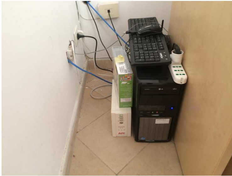
Fig. 10. Sistema di acquisizione dei dati - Sede Area Marina Protetta