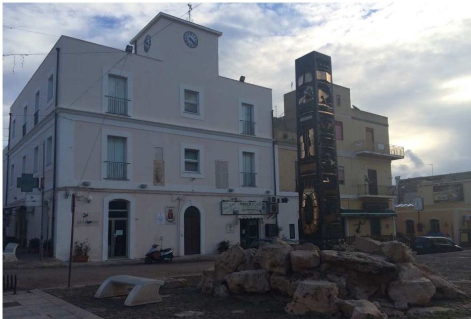
Fig. 1. Nuova sede del Municipio di Lampedusa.