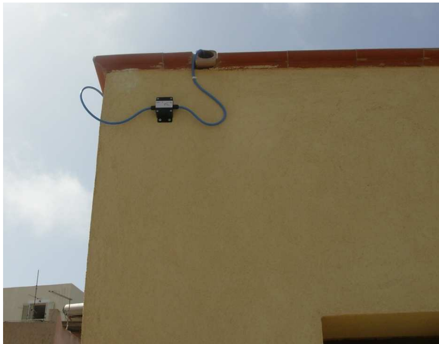
Fig. 9. Nodo 4 – Sede Area Marina Protetta