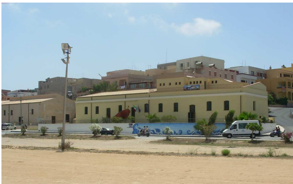
Fig. 2. Sede dell'Area Marina Protetta di Lampedusa.