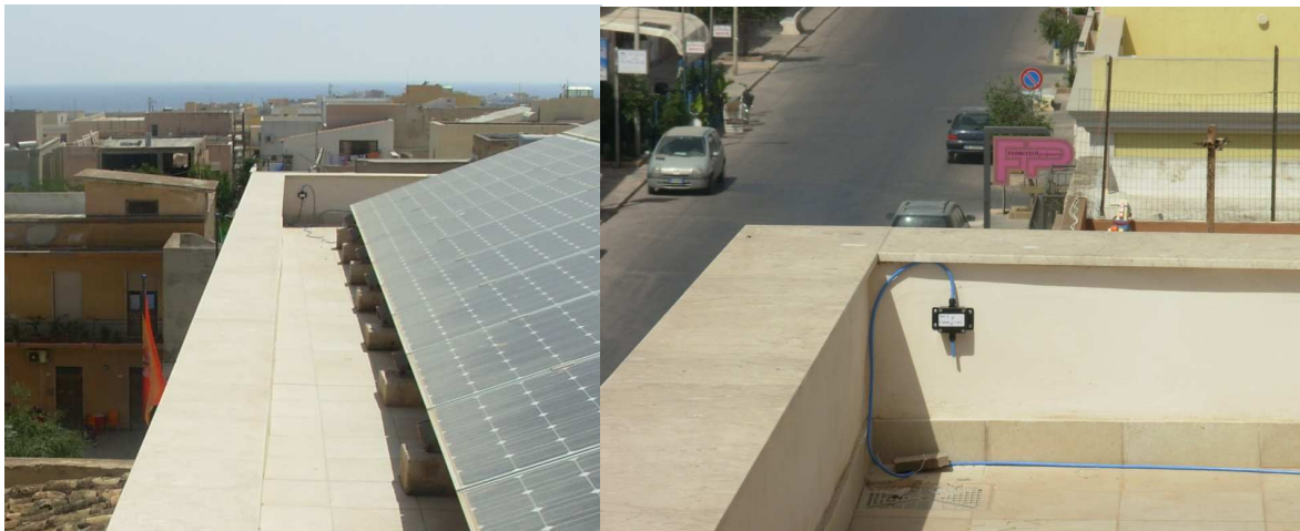
Fig. 5. Nodi 3 e 4 -Nuova sede del Municipio