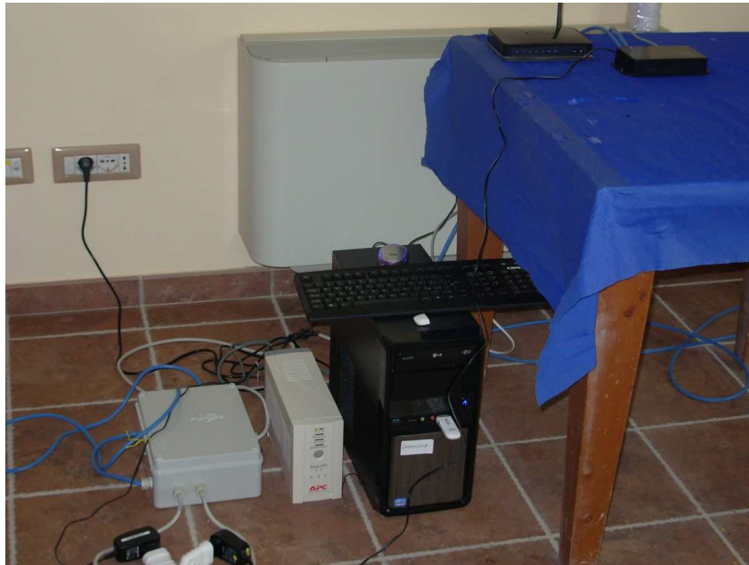
Fig. 6. Sistema di acquisizione dei dati - Nuova sede del Municipio