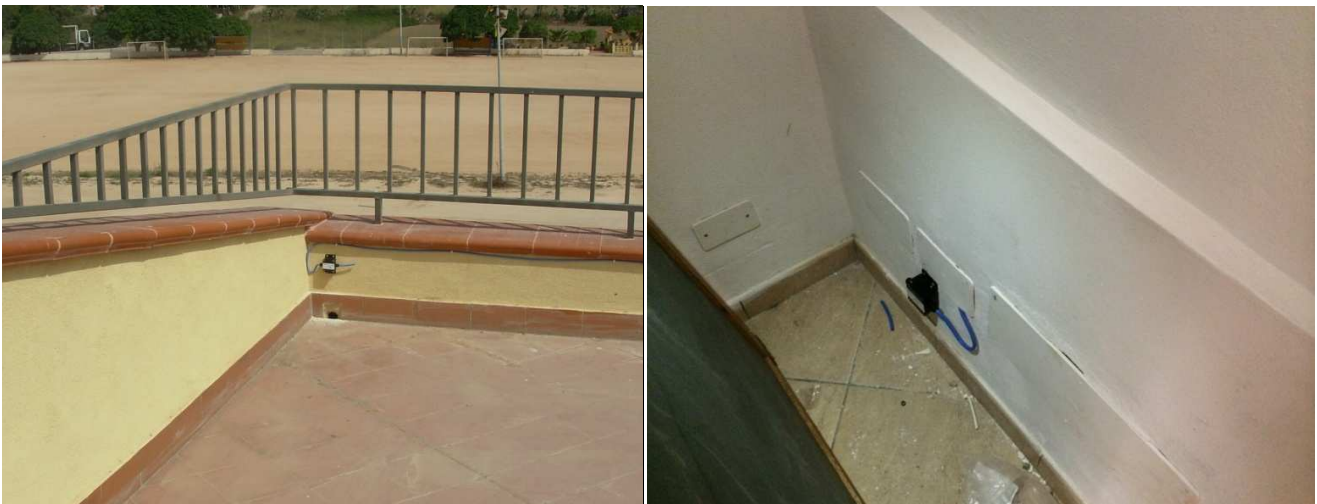
Fig. 7. Nodo 0 e 1 – Sede Area Marina Protetta