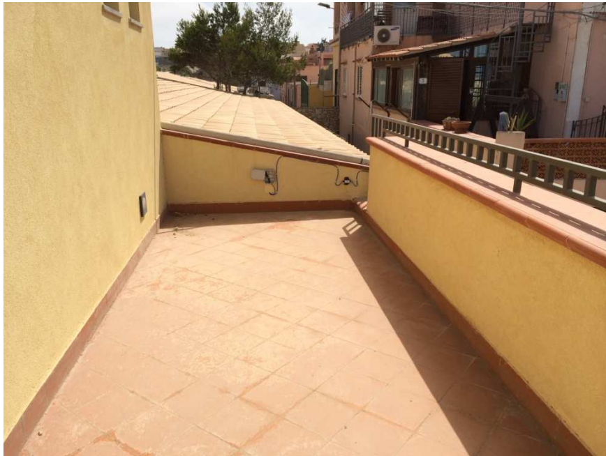
Fig. 8. Nodo 2 - Sede Area Marina Protetta