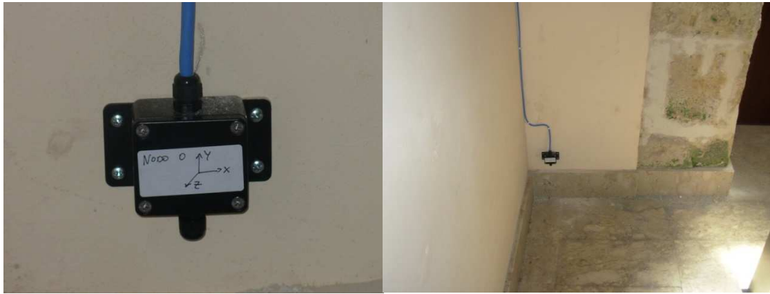
Fig. 3. Nodo 0 – Nuova sede del Municipio